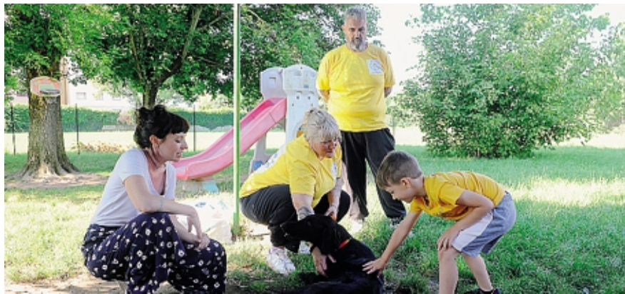
Alcuni momenti della speciale lezione dedicata al mondo degli animali che si è tenuta ieri mattina al campo estivo ospitato alla scuola dell'infanzia Akwaba